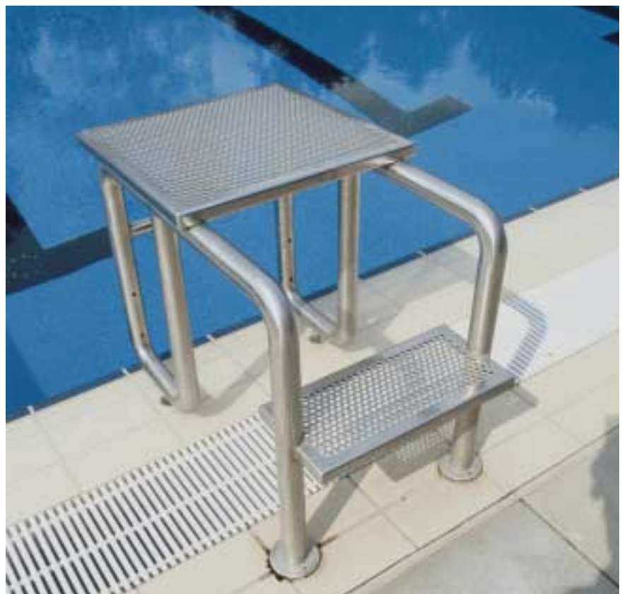
Ein Startblock ganz aus Edelstahl Rostfrei erfüllt höchste Ansprüche an Sicherheit und Design.

Edelstahl Rostfrei ist der bevorzugte Werkstoff, wenn es um die Sanierung von Schwimmbädern geht. Besonders für sanierungsbedürftige Schwimmbecken empfiehlt sich der kostengünstige Einbau einer Edelstahl Rostfrei-Wanne, mit der die alte, schadhaft gewordene Kachelung dauerhaft dicht und