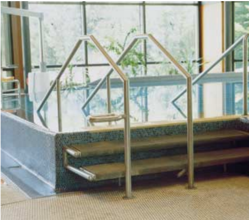
Die ästhetische Ausführung dieses Einstiegsgeländers aus Edelstahl Rostfrei basiert ebenso auf den guten Umformeigenschaften des Werkstoffs sowie auf hervorragender Verarbeitung.

Bauteile aus Edelstahl Rostfrei müssen deshalb in die sorgfältige Unterhaltsreinigung der Schwimmbadanlagen einbezogen werden. Ablagerungsstoffe können mit Wasser aus der öffentlichen Trinkwasserversorgung abgespült werden.