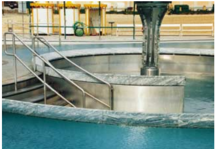
Eleganz schon vor der Flutung: Das kreisrunde Whirlpool-Becken aus Edelstahl Rostfrei, erhöht in das Nichtschwimmerbecken eingebaut, und das geschwungene Einstiegsgeländer zeigen die unterschiedlichen Oberflächenwirkungen des Werkstoffs.

Für Anwendungen in Schwimm- und Badebeckenwässern sind aufgrund der insgesamt steigenden