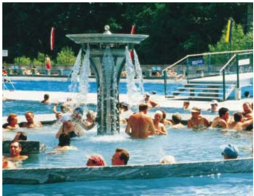
Angenehme Atmosphäre nach der Flutung: Edelstahl Rostfrei ist optisch ansprechend, hier in Kombination mit Granit, und korrosionsbeständig, besonders in stark erwärmtem Wasser und in der dadurch hochchloridhaltigen Luft.

Für Bauteile mit Spalten sowie bei Wässern mit höheren Chloridionengehalten bis etwa 500 mg/l sollten vorwiegend die molybdänlegierten Stähle 1.4401/1.4404 bzw. 1.4571 verwendet werden.