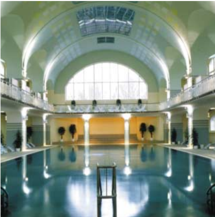
Beständige Schönheit und vollendete Harmonie: Schwimmbecken und Einstiegstreppe und Geländer aus Edelstahl Rostfrei in einem restaurierten Jugendstil-Hallenbad.