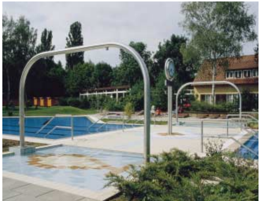
Die Duschanlage aus Edelstahl Rostfrei läßt sich aufgrund der glatten Werkstoffoberfläche sowie der geschlossenen Konstruktion leicht reinigen. Da Edelstahl Rostfrei gegen die auch in Freibädern chloridhaltige Umgebung beständig ist, ist die Anlage dadurch wartungsarm und langlebig.

Chloridhaltige Verbindungen, die u.a. aus den Chemikalien für die Schwimmbadwasseraufbereitung herrühren, können über die Schwimmhallenatmosphäre auch auf Oberflächen einwirken, die vom Schwimmbecken weit entfernt liegen. Diese Verbindungen kön-