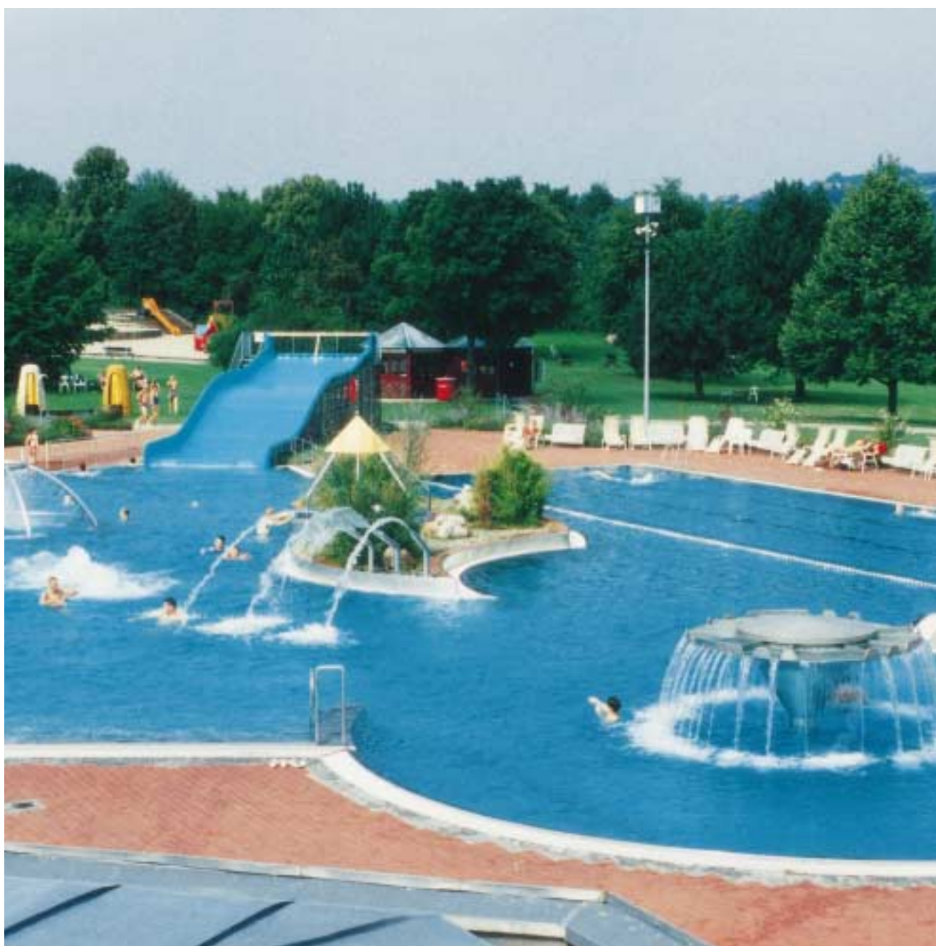
Die vielfältigen Einsatzmöglichkeiten des Werkstoffs Edelstahl Rostfrei auf einen Blick: Schwimmbecken mit unterschiedlichen Höhen, Einstiegsleitern und Brunnen.