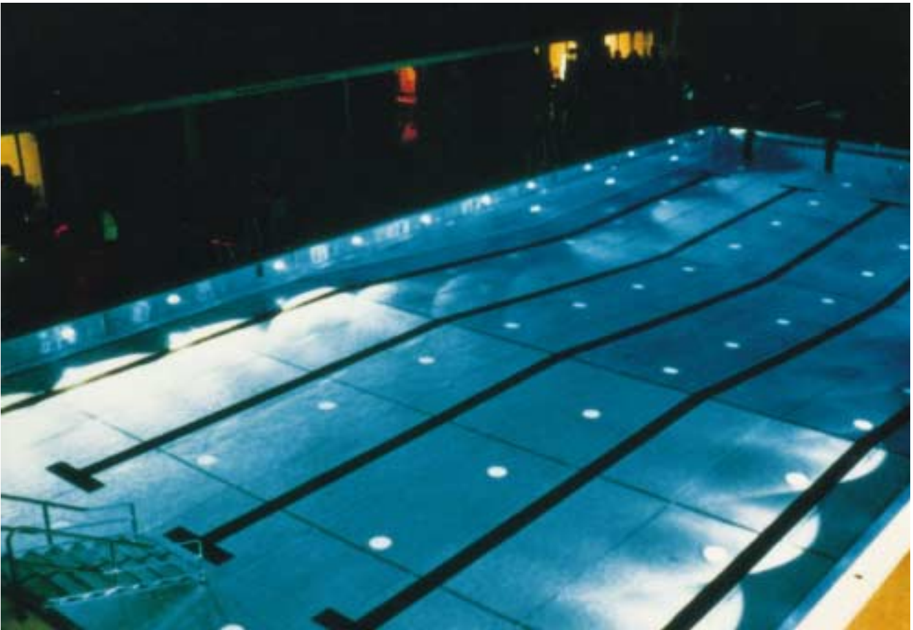
Das gut ausgeleuchtete Schwimmbecken aus Edelstahl Rostfrei schafft stimmungsvolle Badeerlebnisse. Die Tauchstreifen im Beckenboden sind elektrolytisch eingefärbt.

Bei noch höheren Chloridionen- konzentrationen sind aus werkstoff- kundlicher Sicht, je nach den kon-