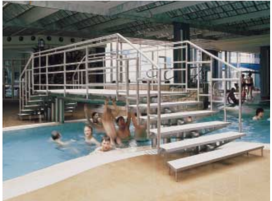
Diese Brücke komplett aus Edelstahl Rostfrei ist ein gutes Beispiel für eine empfehlenswerte Konstruktion im Spritzwasserbereich.

N \leq 0,11 N \leq 0,11 N \leq 0,11 Ti 5xC bis 0,70 Ti 5xC bis 0,70 N \leq 0,11 N \leq 0,11 N 0,10 - 0,22 N 0,12 - 0,22 Cu 1,20 - 2,00, N \leq 0,15 Cu 0,50 - 1,50, N 0,15 - 0,25 N 0,30 - 0,60, Nb \leq 0,15 Cu 0,50 - 1,00, N 0,18 - 0,25