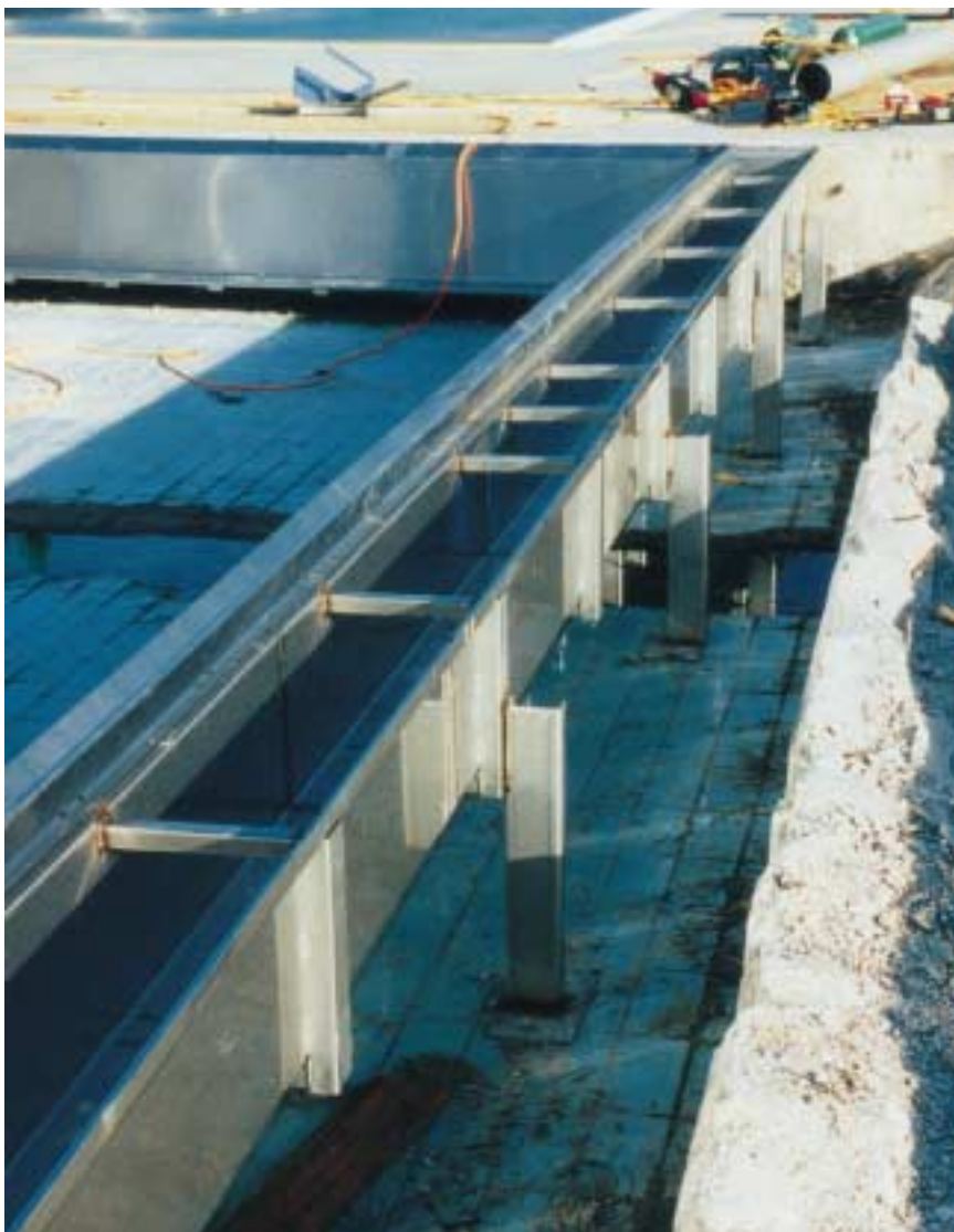
Die Sanierung von Schwimmbecken mit Edelstahl Rostfrei ist auch im Winter möglich – und ohne daß die alte Auskleidung entfernt werden muß.

Auf die uneingeschränkte Verwendung höherwertiger nichtrostender Stähle wird im Kapitel 7.2 eingegangen.