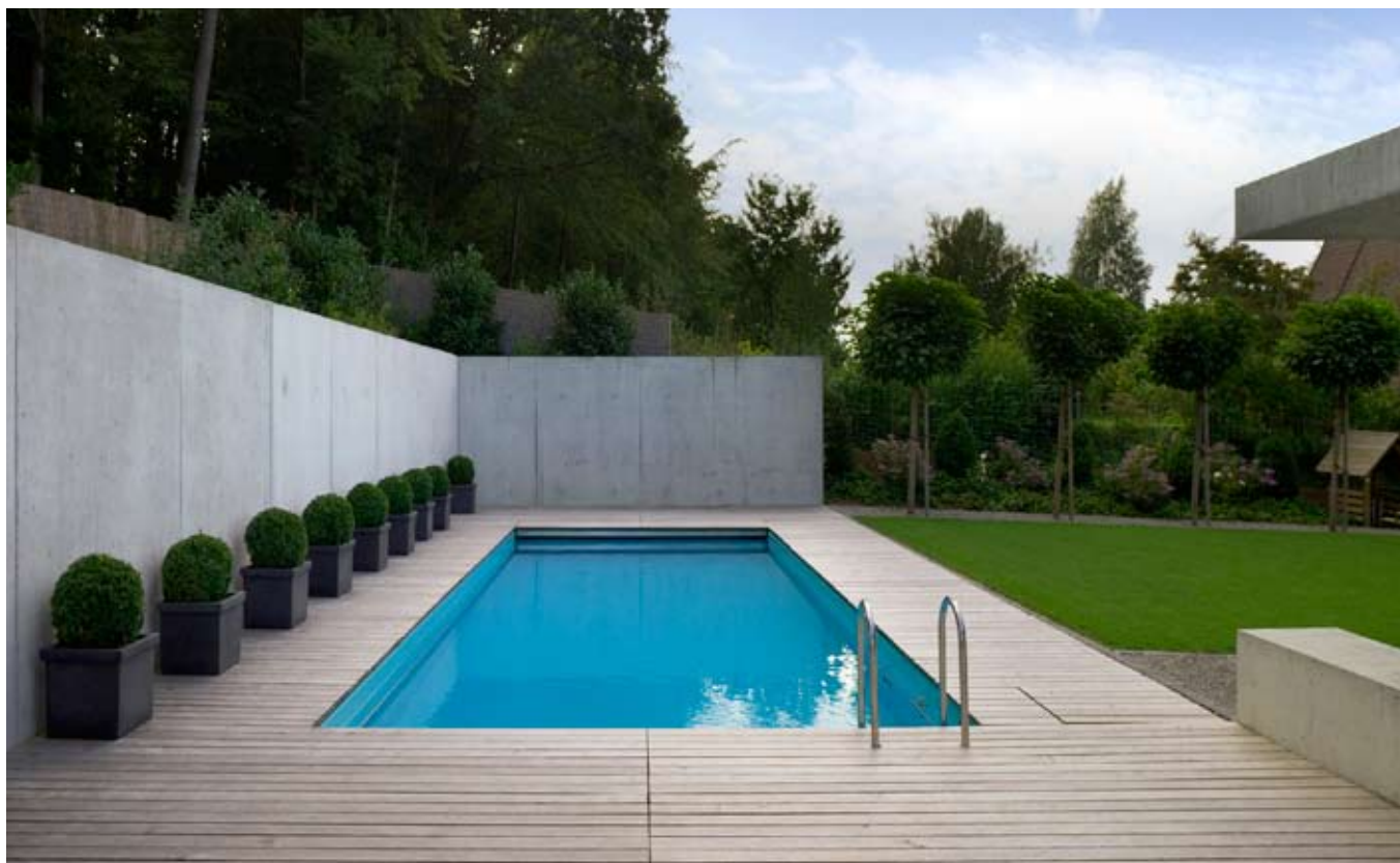
Schwimmbadumrandung mit einem Rost aus hartem Buchenholz.

«Thermohölzer» haben ebenfalls eine sehr hohe Haltbarkeit, und das ohne Einsatz von Chemikalien. Beim thermischen Verfahren werden die Hölzer erhitzt, man kann auch sagen «gebacken», um so die Fähigkeit des Holzes, Wasser aufzunehmen, herabzusetzen. Eine weitere Technik, um die Haltbarkeit zu verbessern, ist die Art, wie Hölzer verlegt werden, sprich die Unterkonstruktion. Idealerweise