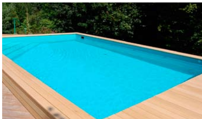
Die Robinie (falsche Akazie) ist ein sehr helles Holz.